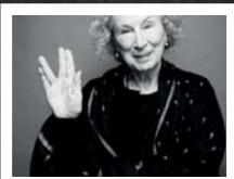
MARGARET ATWOOD Die Grande Dame der kanadischen Literatur, wird 80! Wir gratulieren!