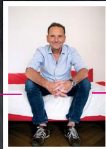
Kommt: Filmemacher ERWIN WAGENHOFER